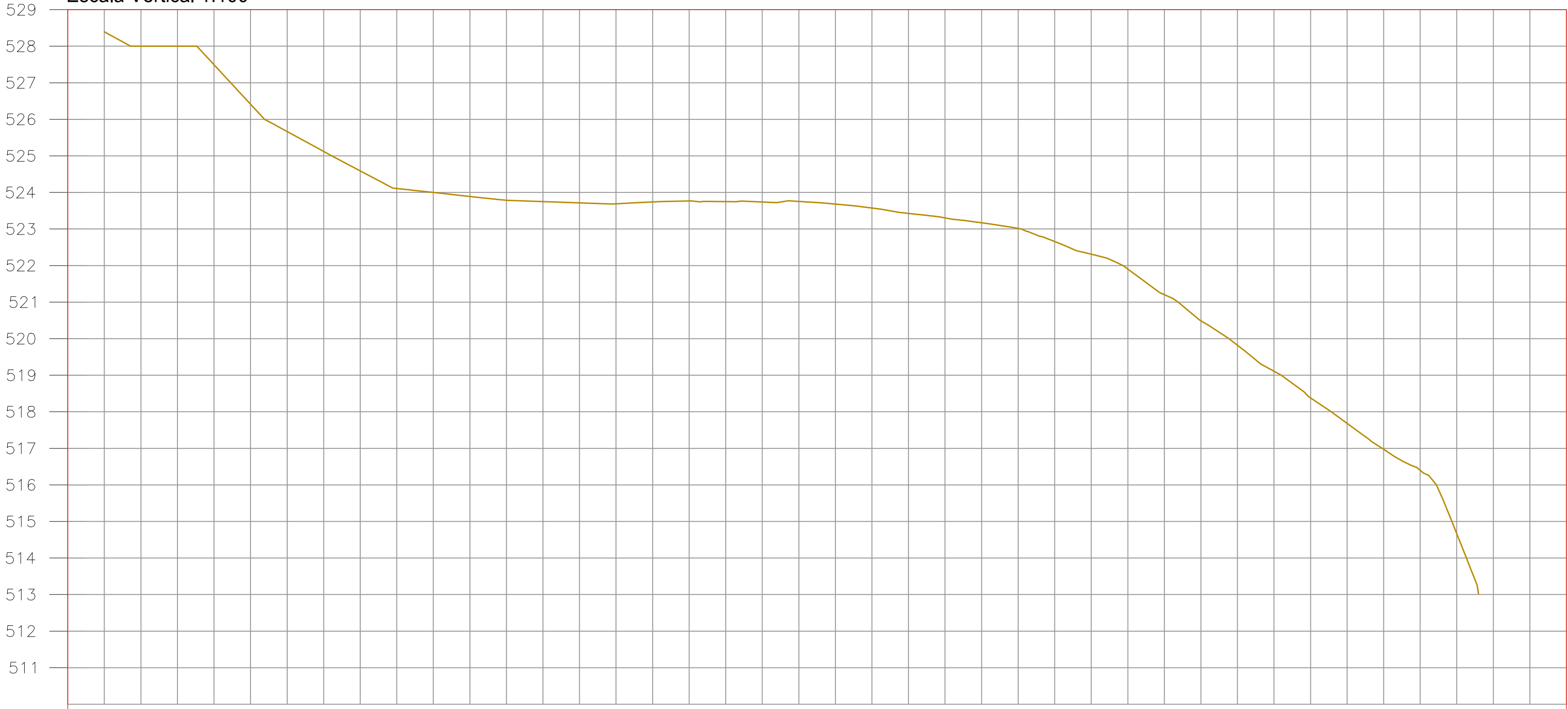
Emissário Final Escala Horizontal - 1:1000 Escala Vertical 1:100